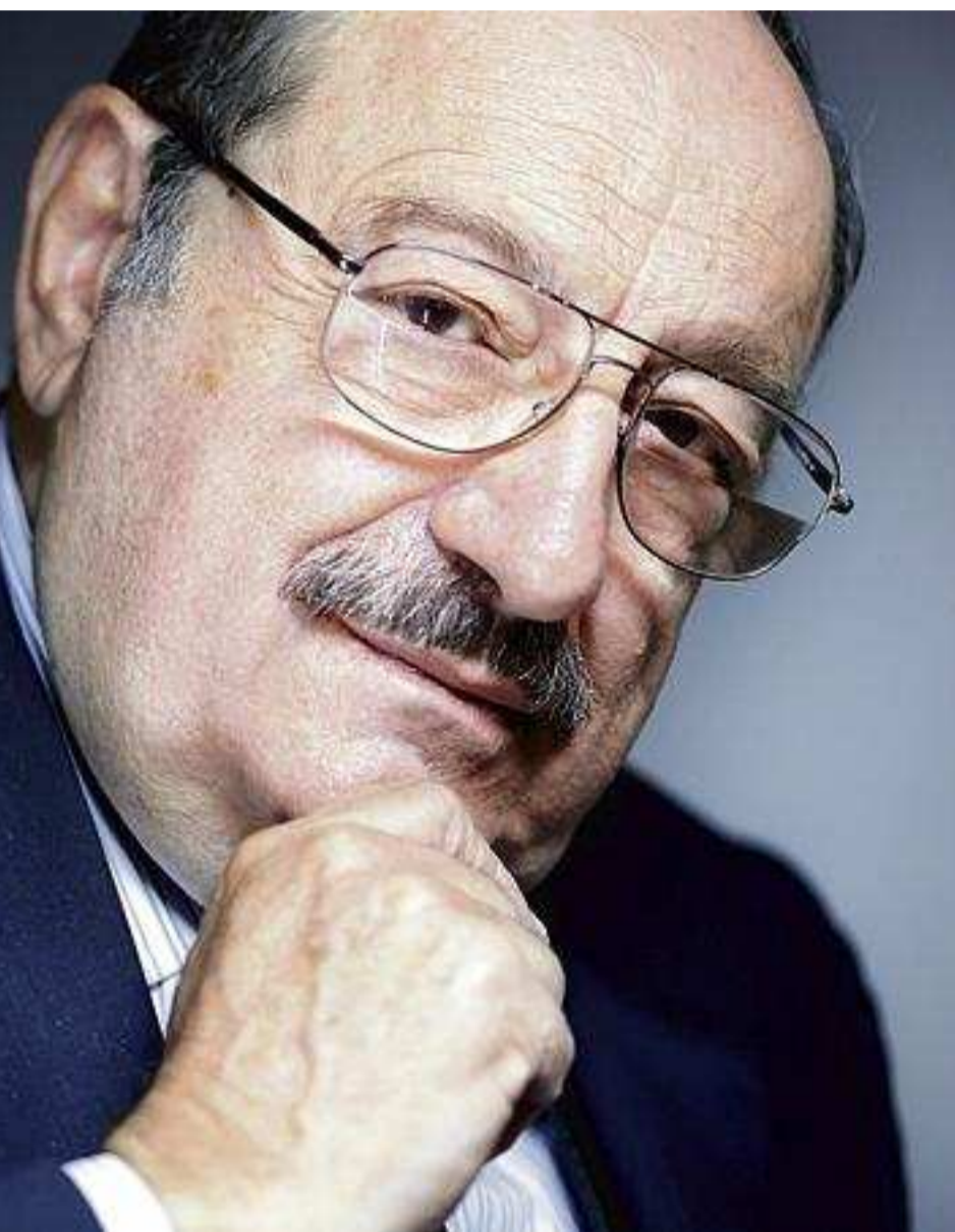
En 2009.